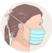
J'attache le bas de mon masque