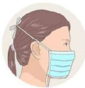
J'attache le haut de mon masque