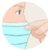
Je pince le bord rigide pour l'ajuster à mon nez