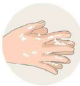
Je me lave les mains