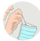
Pour le retirer, je ne touche que les attaches