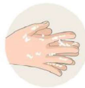
Je jette mon masque et je me lave les mains